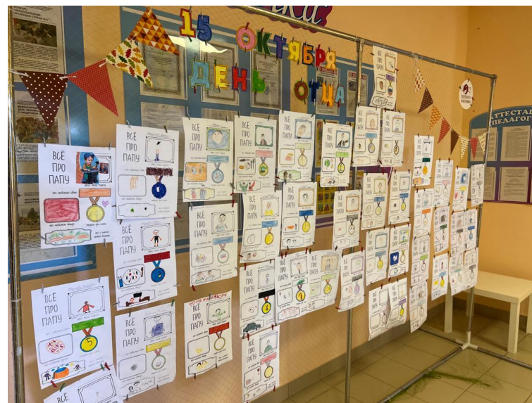
Элементы «Говорящей среды»