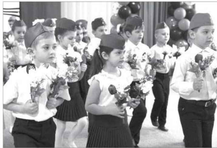
■ Воспитанники д/с «Бабочка» готовятся ко Дню Победы.

Праздник Дня Победы, тот самый «праздник, со слезами на глазах» – это священная память о защитниках нашей Родины и дань безмерного уважения ныне