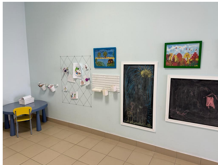
АРТ-галерея, холл 2-го этажа